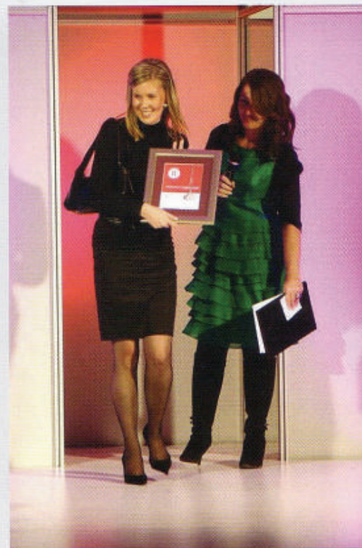
Slika 2: Drugu nagradu za inovaciju osvojila IntAct Group za nordijsko hodanje koje koristi posebno dizajnirane štapove koji uključuju i gornji dio tijela u vježbu hodanja

Drugoga dana konferencije na reviji predstavile su modne tvrtke Claire Group (Danska), Kriss Sweden (Švedska), IC Company - Soaked in Luxury, SISCIA i Freinds Design. Program revije i dodjele nagrade vodila je Barbara Kolar. Tom prigodom predstavljen je i novi miris Amethyst Fatale edt tvrtke Oriflame.