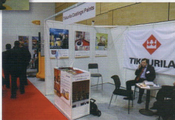
Slika 6: Ekološkim premazima i bojama predstavila se i tvrtka TIKURILA