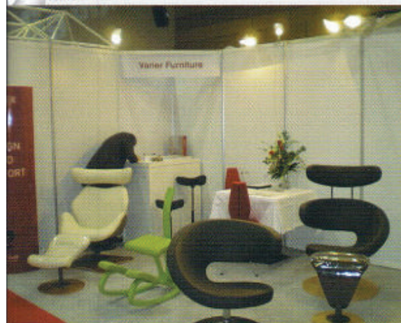
Slika 5: Vrhunski dizajn namještaja: Varier furniture