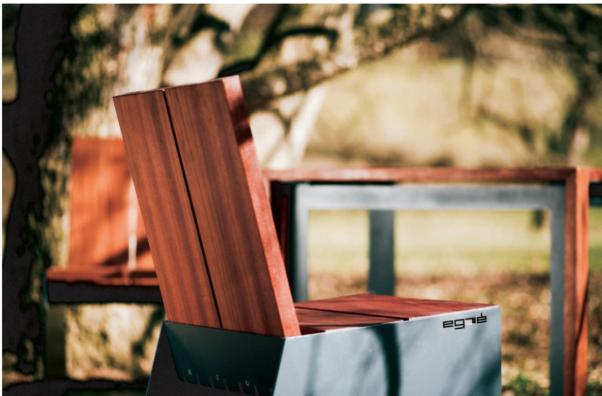
egoé klupa linija RADIUM

Na temelju znanja i iskustva u opremanju velikih javnih površina mmcité je pokrenuo novu specijaliziranu liniju egoé koja je prikladna za opremanje svih vrsta manjih eksterijera, kao što su vrtovi ili dvorane restorana i hotela. Ovu liniju ekskluzivnog i luksuznog namještaja oblikuju eški i me unarodni dizajneri.