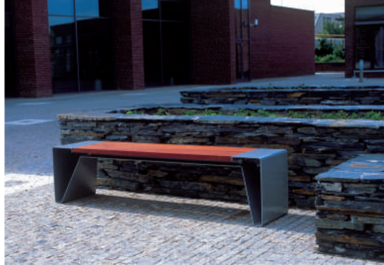
mmcité klupa linija RADIUM

Osim toga, sudjeluju na eškim i svjetskim izložbama industrijskog dizajna, a pojedini elementi dio su zbirki poznatih muzeja.